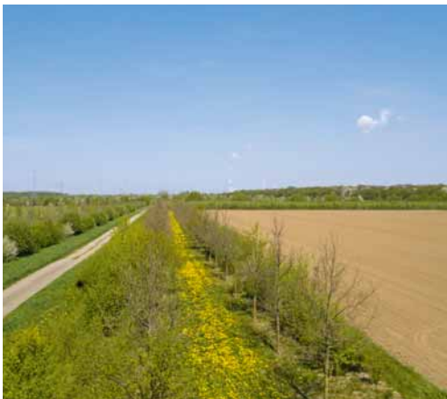
Blick auf eine Vernetzungsstruktur